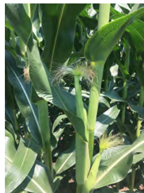
DKC4792 Komárom, 2018