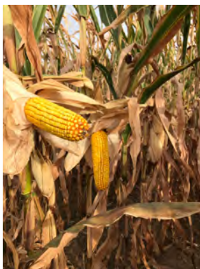
DKC4792 Kánya, 2019

...akik a FAO 300 éréscsoport közepén szeretnének egy kiemelkedően stabil és nagy termőképességű hibridet termeszteni.