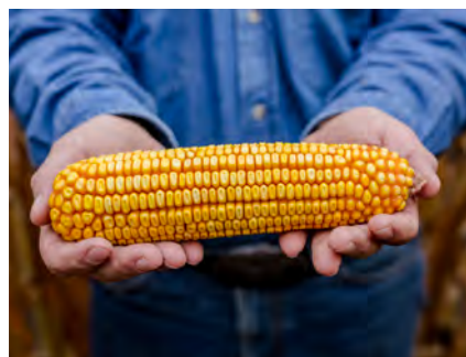
DKC5068, Hajdúszovát, 2018.