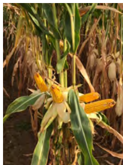
DKC5092 Kánya, 2019

...akik szívesen kipróbálnak egy olyan új hibridet, amely a magyar fejlesztési kísérletekben a DKC4943-nál is jobban teljesített. A kimagasló terméspotenciál mellett kirobbanó korai fejlődési erély és gyors vízleadás jellemzi.