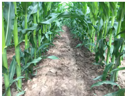
DKC5092 Komárom 2019