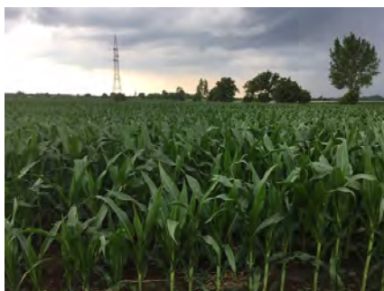
DKC5182, 2019.

...akik készen állnak a rekordtermés elérésére jó körülmények között, intenzív termesztési területre. Legnagyobb előnye, hogy rövid időn belül, gyorsan adja le a vizet, és jól reagál a tőszámsűrítésre.