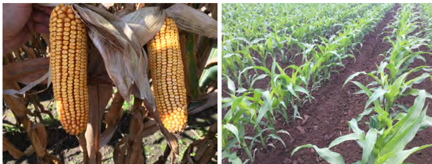
DKC5685 Komárom, 2018

...akiknél a megcélzott termés hozam a 12 tonna/ha vagy afelett, és az éréscsoporton belül korán vethető hibridet keresnek. Kifejezetten jó körülményekre, intenzív termesztési területekre ajánljunk, ahol akár öntözés is megoldott.