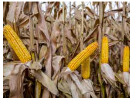
DKC4351, Hajdúszovát, 2018.