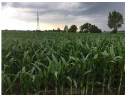
DKC5182, Rém, 2019.

...akik készen állnak a rekordtermés elérésére, intenzív termesztési technológiával, jó körülmények között. Legnagyobb előnye, hogy rövid időn belül, gyorsan adja le a vizet, és jól reagál a tőzsámsűrítésre.