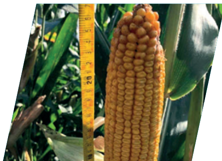
/// DKC5206, Borota, 2020