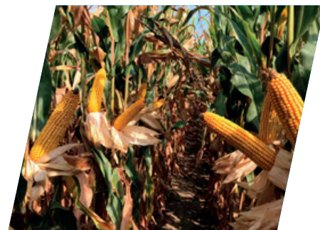
/// DKC5206, Bihardancsháza, 2020