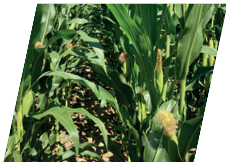
/// DKC5206, Dalmand, 2020

...akik intenzív termesztési technológiában szeretnének csúcskategóriás hibridet termesztetni, valamint az elérhető maximális terméshozam mellett a csőegészség is fontos.