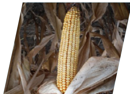
/// DKC3972, Mosonmagyaróvár, 2020