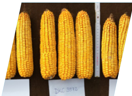
/// DKC3972, Mosonmagyaróvár, 2020