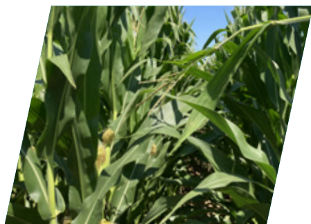
/// DKC5685, Dalmád, 2020

...akiknél a megcélzott terméshozam a 12 t/ha vagy afeletti és az éréscsoporton belül korán vethető hibridet keresnek. Kifejezetten jó körülményekre, intenzív termesztési területekre ajánljunk, ahol akár az öntözés is megoldott.