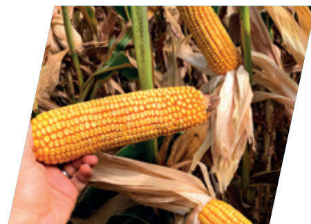
/// DKC5685, Létavértes, 2020