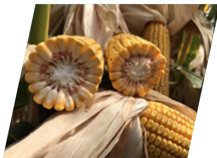
/// DKC5685, Gesztely, 2020