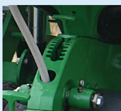
Mélységhatároló kereket szabályzó orsó

A vetés mélységének meghatározásánál alapvetően 2 tényezőt kell figyelembe vennünk. Az egyik a talajnedvesség szintje, a másik a magméret.