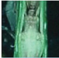
Barnult, elhalt növekedési pont, a növény biztosan elpusztul

A még menthető állományt érdemes lehet tápkultivátorozással, lombtrágyázással segíteni. Abban az esetben, ha károsult növényeken nem jelenik meg új, zöld levél, a tábla újratvetése szükséges.