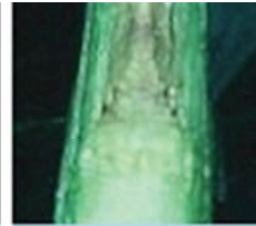
Elszínéződött növekedési pont, a növény valószínűleg elpusztul